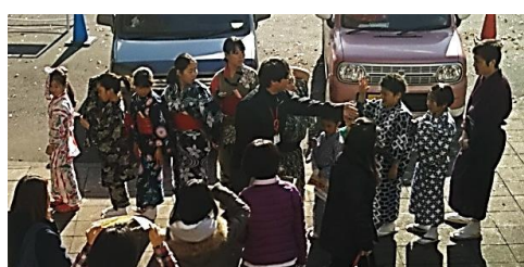
避難訓練で人数を確認することも歌舞伎の皆さん

これからも防犯や災害についての意識を高め、臨機応変な行動ができるよう、こうした講習会や訓練を行っていきたくと思います。