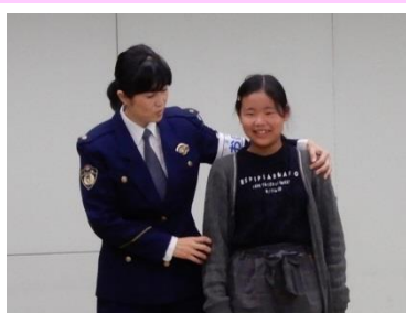
緊急時の対処法を教わる少年少女オーケストラの団員

千葉県少年少女オーケストラと千葉県こども歌舞伎アカデミーは、防犯講習会（11月26日）と避難訓練（12月2日）を行いました。