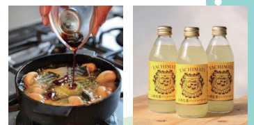
千葉の魅力発見コーナー