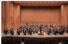
千葉交響楽団