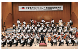
千葉県少年少女オーケストラ