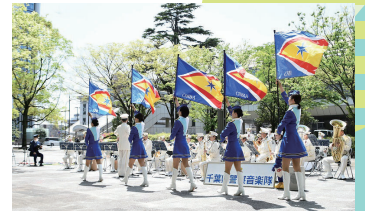
県警音楽隊・カラーガード隊