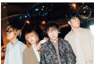
レトロリロン ※映像出演