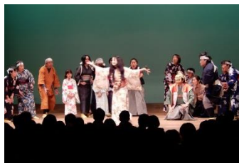
平成28年度「里見八犬伝 其ノ零」