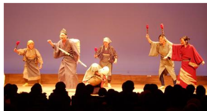
平成30年度「里見八犬伝 其ノ貳」