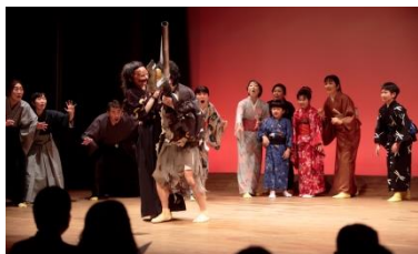
平成29年度「里見八犬伝 其ノ壹」