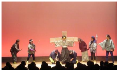
令和元年度「里見八犬伝 其ノ参」