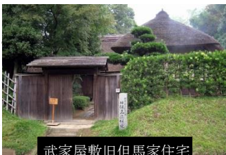
武家屋敷旧但馬家住宅