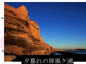
夕暮れの屏風ヶ浦